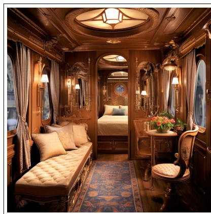
Une cabine individuelle